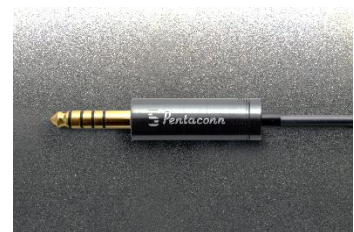
日本ディックス社製 金メッキ処理Φ4.4mm 5極プラグ 無酸素銅導体採用プレミアムタイプ